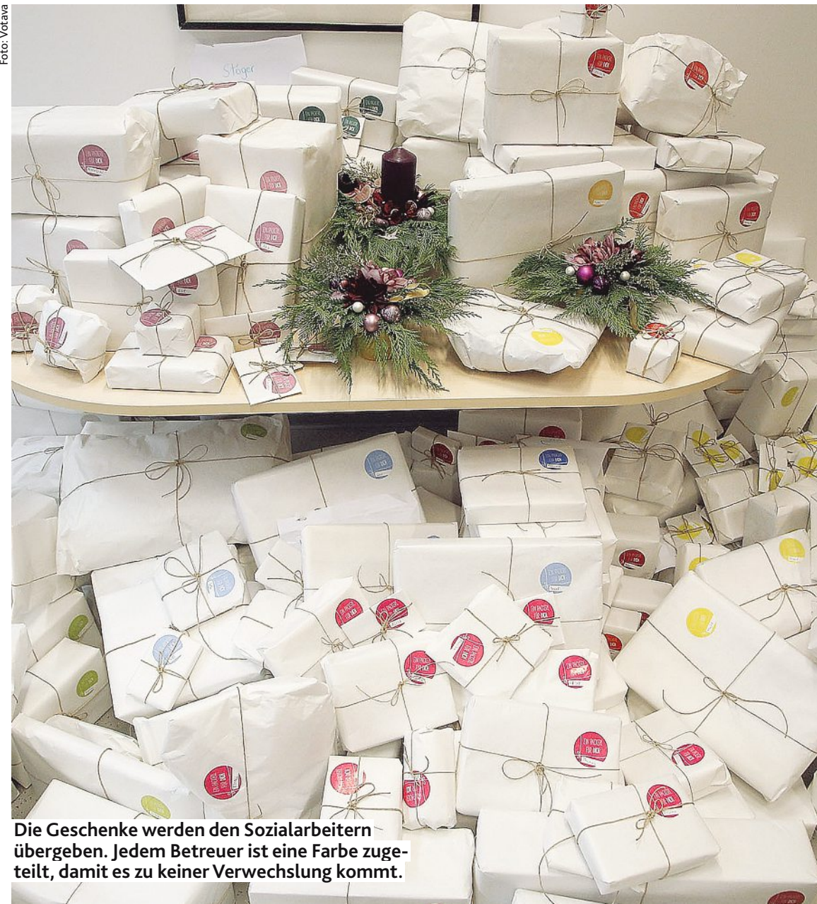
Die Geschenke werden den Sozialarbeitern übergeben. Jedem Betreuer ist eine Farbe zugeteilt, damit es zu keiner Verwechslung kommt.